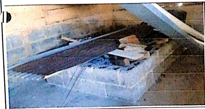
FOTO 5 PARRILLA DE METAL 50CM X 200CM